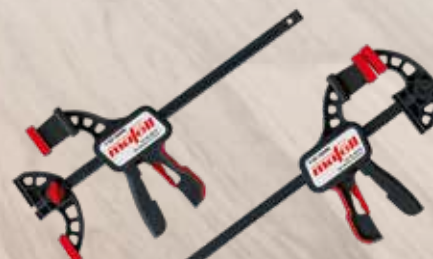
Morsetto F-SZ 180MM

2 pezzi, per il fissaggio della guida al pezzo di lavorazione