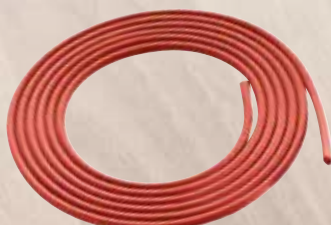
Profilo in gomma F-HP 6,8M