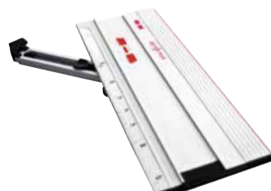
Battuta angolare F-WA