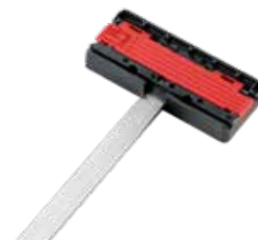
Battuta parallela P-PA

con funzione quadrupla, con dispositivo tagli circolari