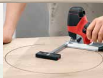
Funzione a compasso