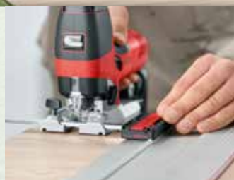
Adattatore delle barre guida