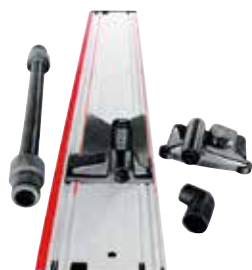
Sistema di fissaggio sottovuoto