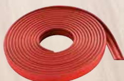
Protezione antiscreggia F-SS 3,4M