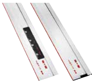
Barra guida F

Ogni progetto ha le sue sfide speciali. E' bene che tu sia adeguatamente preparato per loro. Con gli accessori speciali MAFELL per la P1 cc si ottiene sempre un taglio perfetto.