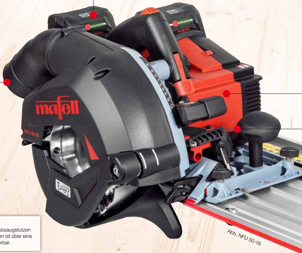
Abb. NFU 50-18

HOCHLEISTUNGSMOTOR steht für geballte Power und hohe Durchzugskraft und verfügt über eine leistungsoptimierte Digital-Elektronik.