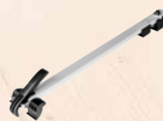
Seitenanschlag SA 625