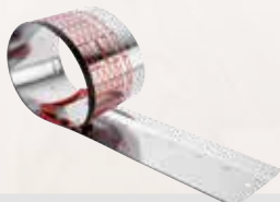
Flexibele liniaal FX 140

1,4 m met anti-splinterstrip Bestelnr. 204372