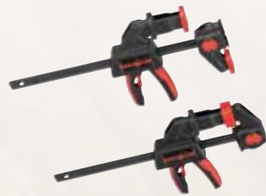
Sargento F-SZC 180

2 unidades, para la fijación del carril guía en la pieza