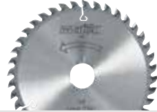
Hoja de sierra HM

120 x 1,2/1,8 x 20 mm, Z 40, FZ/TR, para cortes finos de madera