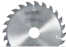
Hoja de sierra HM

120 x 1,2/1,8 x 20 mm, Z 24, WZ, para el uso universal de madera