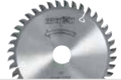
Hoja de sierra HM

120 x 1,2/1,8 x 20 mm, Z 40, TR, para laminados