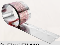
Guía-Flexi FX 140