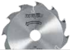
Hoja de sierra HM

La potente KSS 40 18M bl es un perfeccionamiento consecuente de la KSS 300 con la tecnología de batería más moderna. Esta máquina sorprende por su gran capacidad de rendimiento y sus amplios accesorios en el volumen de suministro.