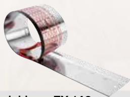
Flexiskinne FX 140

120 x 1,2/1,8 x 20 mm, Z 40, TR, til laminatgulve Best.-nr. 092578