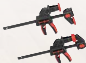
Klemtvinge F-SZC 180

1,4 m med opriftbeskytter Best.-nr. 204372