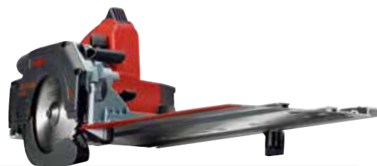
KSS 40 18M bl