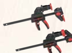
Morsetto F-SZC 180

2 pezzi, per fissaggio della guida al pezzo in lavorazione Codice 093868