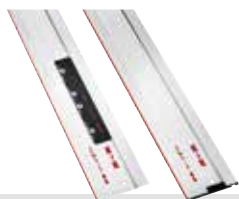
Barra guida F