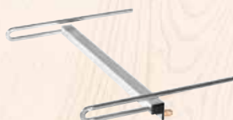
Battuta di riscontro inferiore (K 105)