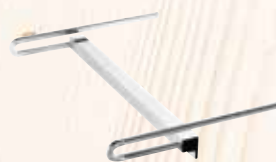
Battuta di riscontro inferiore (K 85)