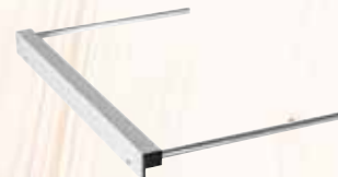
Battuta parallela (K 105)