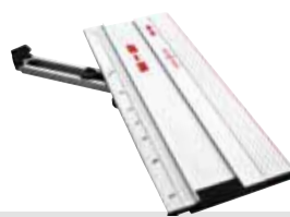
Battuta angolare F-WA

di unione per battute parallele Codice 204363