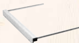
Battuta parallela (K 85)

2 x F-SZ 180 MM + 2 x F 160 + F-VS + Borsa per barra guida Codice 209591