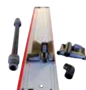
Sistema di Fissaggio e Aspirazione

Aerofix F-AF 1 con barra guida 1,3 m, adattatore superiore e inferiore, tubo flessibile Codice 204770