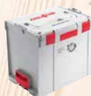
L-MAX (K 85)