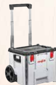
Valigetta per trasporto (K 105)

Trolley L-BOXX Contractor C476-TB-K 105 Codice 095284