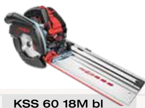
KSS 60 18M bl