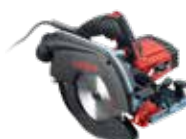
K 65 cc