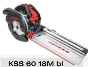
KSS 60 18M bl