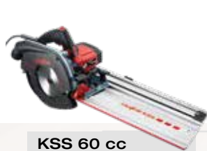
KSS 60 cc