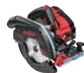
K 65 18M bl