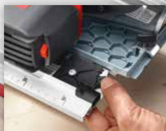
DESBLOQUEO DE LA GUÍA

Con solo pulsar un botón, se puede soltar la máquina del carril guía de retestado y utilizar con todas las posibilidades de aplicación de la K 65 cc.