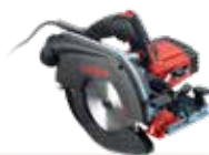
K 65 cc