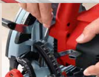
TOPE DE REPETICIÓN PARA LA PROFUNDIDAD DE CORTE

Si se realizan cortes repetitivos con la misma profundidad, se puede preajustar con exactitud y fijar una profundidad de corte entre 2 y 61 mm.