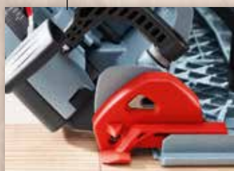
POSUVNÝ UKAZATEL ŘEZU

Hloubku řezu u K 65 cc lze rychle a bezpečně nastavit. Po stlačení aretace lze nastavit podle stupnice přesnou hloubku řezu.