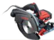
K 65 cc