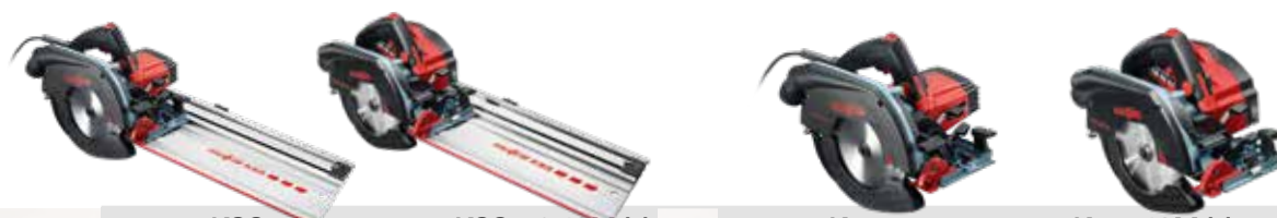
KSS 50 cc