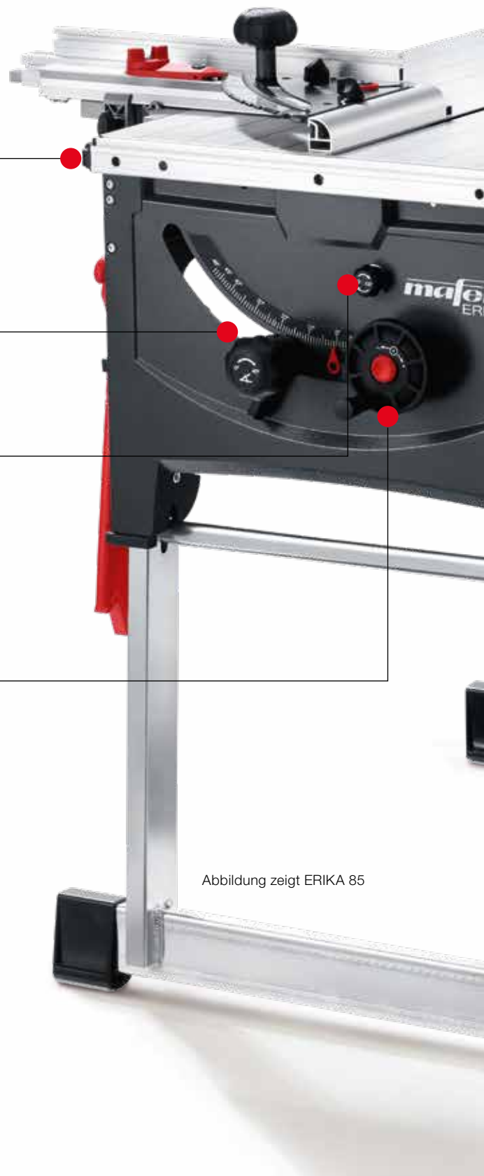
Abbildung zeigt ERIKA 85