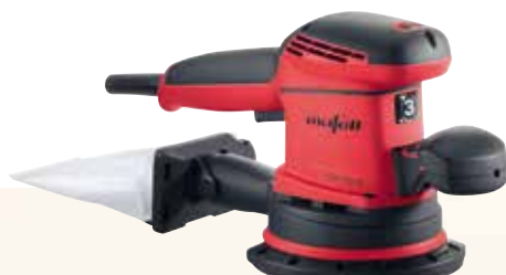
EVA 150 E / 3