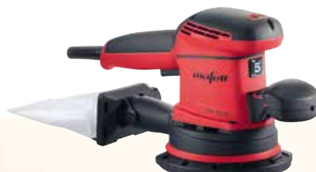
EVA 150 E / 5